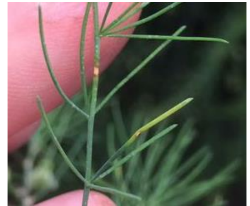
Stemphylium in asperge

*Op vroeg gestopte percelen en nieuwe aanplant kunt u overwegen om een extra bespuiting met 0,8 ltr Luna Sensation uit te voeren tussen de 1 e en 2 e bespuiting.